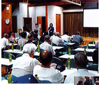
←保健師さんの講話