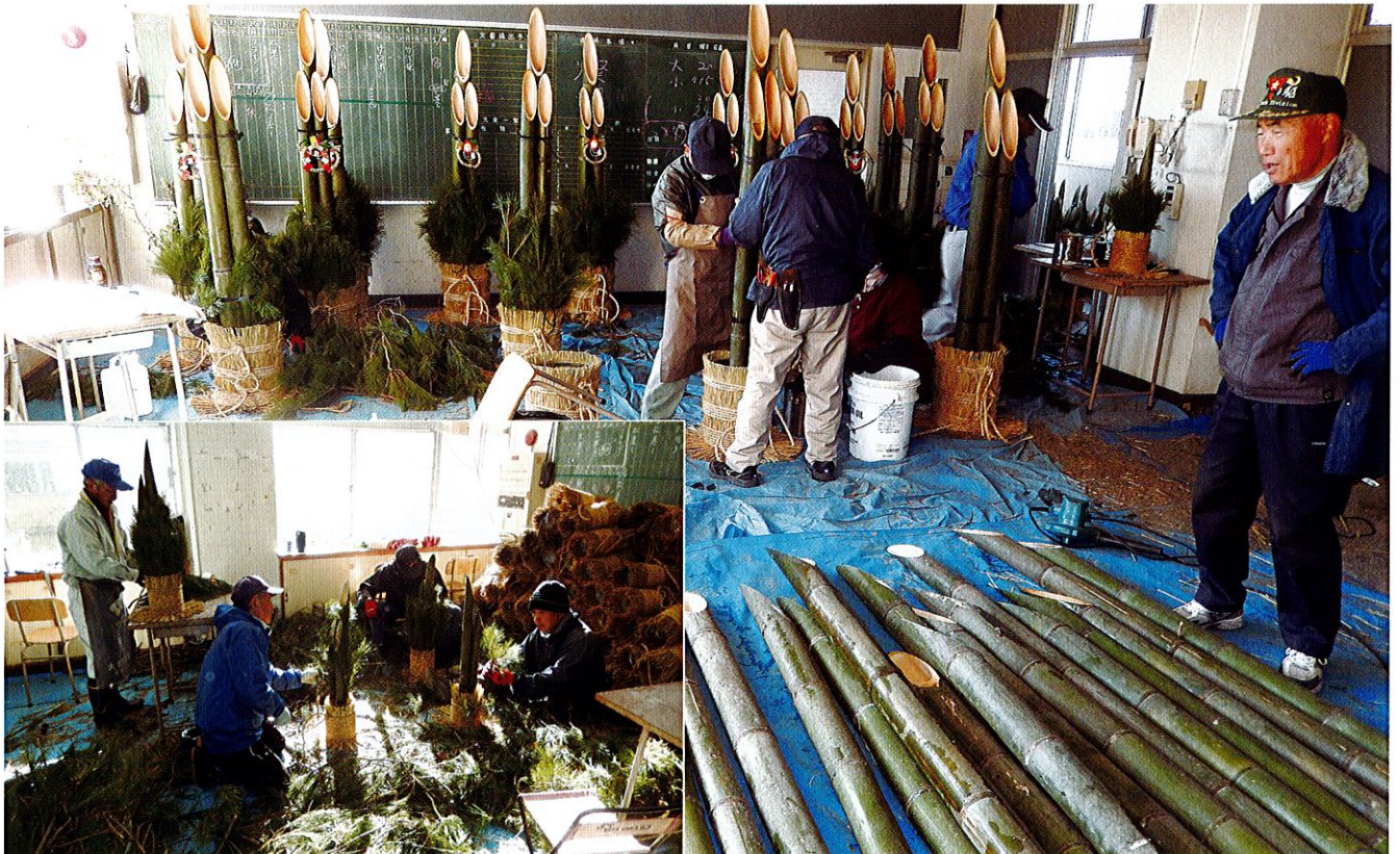
心を込めて大小門松製作